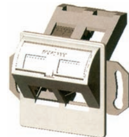
UP/EK50 Dose für GG45-Buchse (Snap-In)

Weitere Stecksysteme der Kategorie 7 (wie TERA von SIEMON) sind ebenfalls erhältlich.