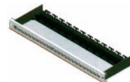
Patchpanel für GG45-Buchse (Snap-In)