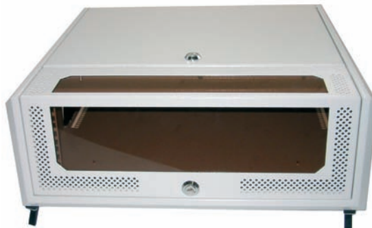
MFC als Tischgehäuse 3HE