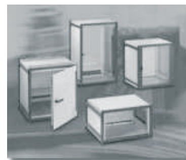
LanRack DoublePro Serie