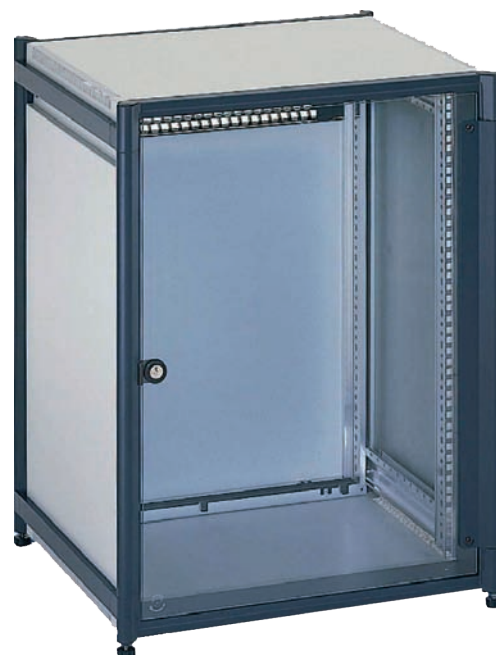
LanRack DoublePro Standschrank