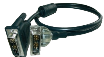
DVI + Winkelstecker

DVI-Kabel 18+1, Single-Link, variable Länge DVI-Kabel 24+1, Dual-Link, variable Länge DVI-Kabel 18+1, Single-Link mit Winkelstecker, variable Länge DVI-Kabel 24+1, Dual-Link mit Winkelstecker, variable Länge