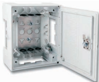
Box I zu 30DA